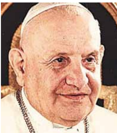
Paus Johannes XXIII

Als ik het gelijk mag verbinden met ons land: in 1965 behoorden de meeste mensen in Nederland nog tot één van de christelijke kerken. Nu is dat volstrekt anders; vele niet-christenen zijn onze landgenoten en andere godsdiensten hebben in onze samenleving een plaats gekregen. De boodschap van Nostra aetate is des te actueler. Daarom ook dat er in 2015 aandacht geschonken zal worden aan deze concilieverklaring. Het eerste moment was de Dag van het Jodendom die jaarlijks in de R.K.-kerk in Nederland gehouden wordt. Op 15 januari werd in de Liberale Joodse Gemeente van Rotterdam - in aanwezigheid van rabbijnen, bisschoppen en de burgemeester van Rotterdam - stil gestaan worden bij wat Nostra aetate heeft bijgedragen aan een nieuwe verhouding van de Kerk tot de joden, het eerste volk van God. Na eeuwen van verwijdering en verwerping heeft juist Nostra aetate bijgedragen aan een ommekeer in deze joods-katholieke verhouding. Het werd het begin van een groei in vertrouwen, waardering en vriendschap. Namens de Nederlandse bisschoppen mag ik in ons land bisschop-referent voor Kerk en