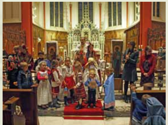
De Oekraïense (kinder)viering

We zaten de week voor Kerst plotseling zonder voorganger voor de Nachtmis. Gelukkig was